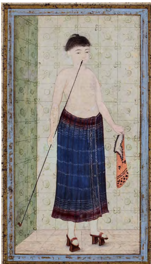
Фото 8. Юноша в хаммаме.

«Керамические трубки-оттоманки из Гизы: к истории табакокурения на Востоке»