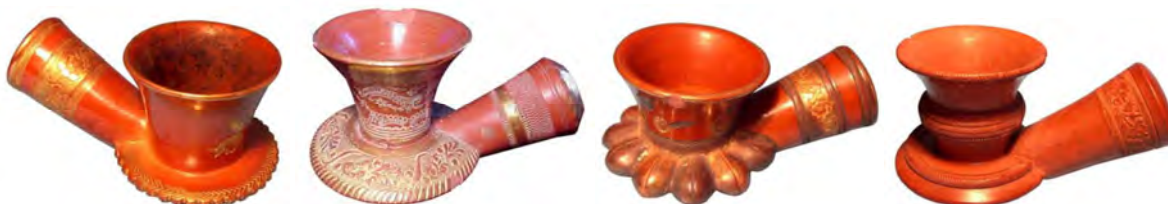
Фото 10. Курительные трубки «стиля Топхане» нарциссовидной формы. Стамбул, 1860-е — 1900-е гг.

(по: URL: https://www.metmuseum.org/art/collection/search/441367?searchField=All&sortBy=Relevance&ft=2015.506.2&offset=0&rpp=80&pos=1 ) (дата обращения 26.06.2020))