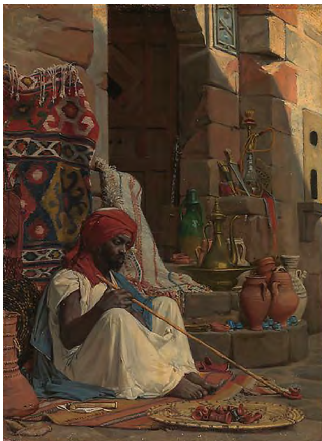
Фото 9. Ж.-Ж. А. Леконт дю Нуи «Торговец в Каире».