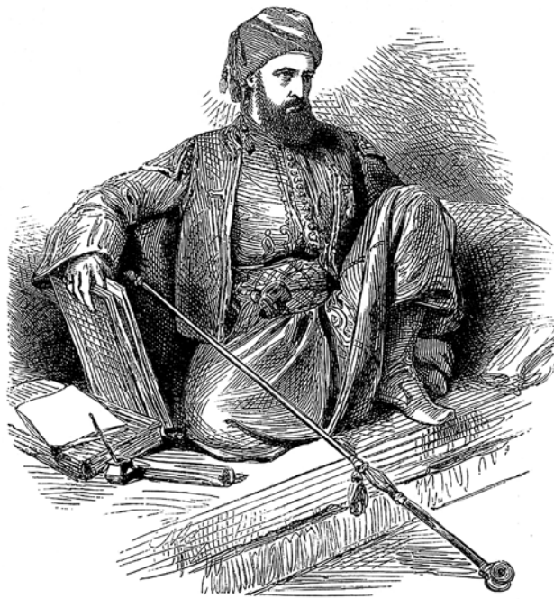
THE LATE MR. E. W. LANE. FROM A DRAWING TAKEN AFTER HIS SECOND VISIT TO EGYPT.

Кому принадлежали трубки, найденные на обрыве плато Гиза, внутри древних гробниц или рядом с ними?