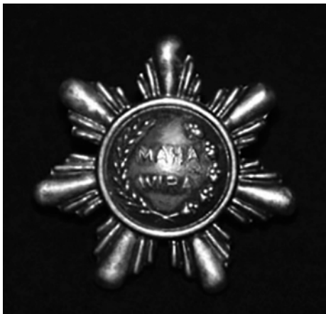
Илл. 2. Нагрудная звезда ордена Священной звезды, принадлежавшая президенту Сухарто (по: Bintang Sakti Soeharto. Kementerian Pendidikan dan Kebudayaan. Direktorat Jenderal Kebudayaan. URL: https://kebudayaan.kemdikbud.go.id/muspres/koleksi-presiden-soeharto-22/bintang-sakti-soeharto/ (дата обращения 04.08.2020))