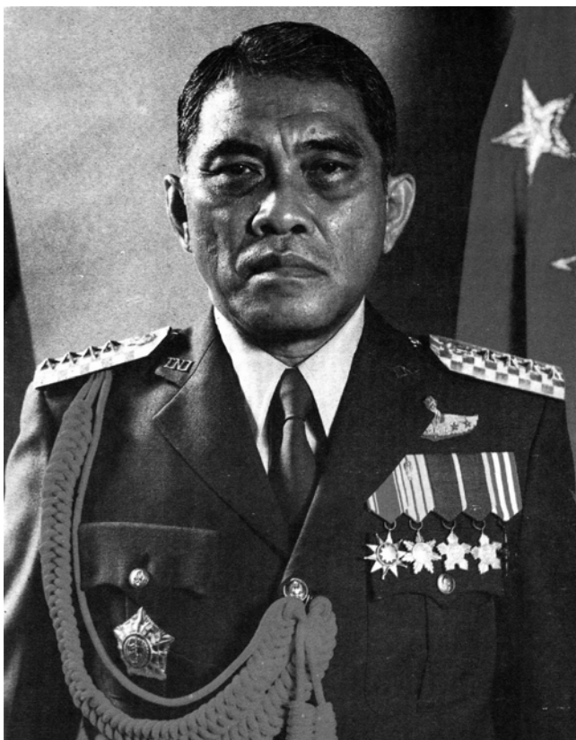
Илл. 3. Генерал армии Бенни Мурдани в бытность главкомом Вооруженных Сил Индонезии. На правой стороне груди должностной знак главкома. На левой стороне груди наградная колодка с пятью орденами: «Великий сын Родины» третьей степени, Священная звезда, два ордена «За верность долгу» (Bintang Dharma) и Партизанская звезда (по: Leonardus Benjamin Moerdani as Commander of the Indonesian National Armed Forces . URL: https://en.wikipedia.org/wiki/Leonardus_Benjamin_Moerdani#/media/File:Leonardus_Benjamin_Moerdani_as_Commander_of_the_Indonesian_National_Armed_Forces.jpg (дата обращения 30.05.2020))

служил в личной охране президента Сукарно — в полку «Чакрабирава» — командиром первого батальона.