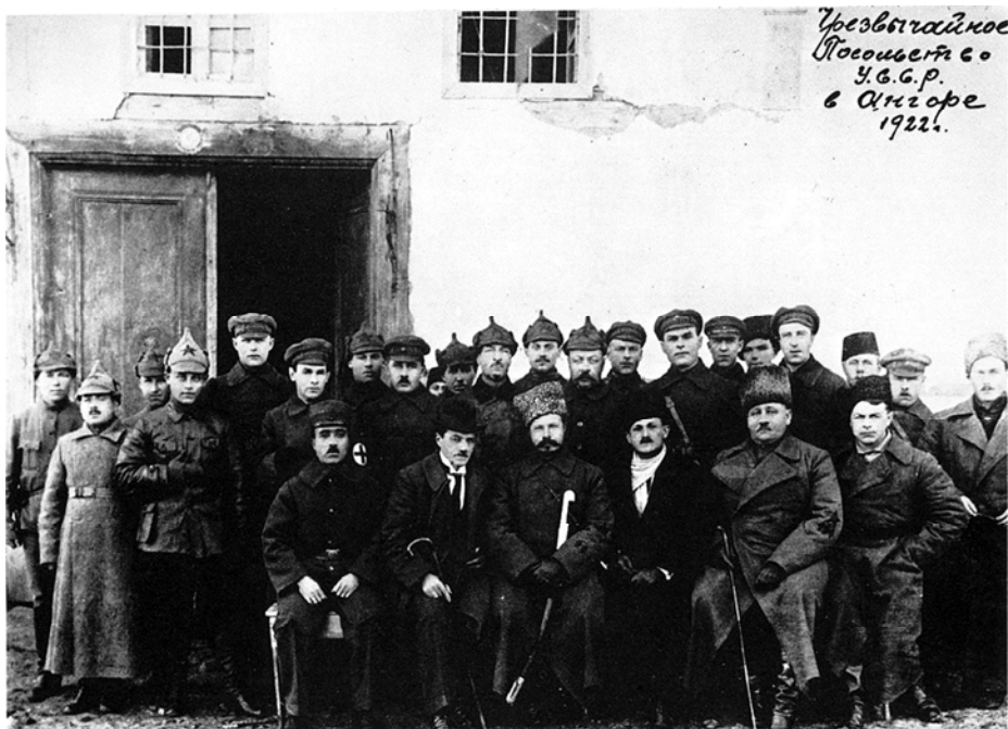
Илл. 4. Чрезвычайное посольство во главе с М. В. Фрунзе в Анкаре, 1922 г. (по: [Фрунзе, 1990, с. 144])

2 декабря 1921 г. Чрезвычайное посольство отбыло из Самсуна и прибыло в Анкару 13 декабря (илл. 4). В Анкаре Фрунзе провел встречи с председателем ВНСТ и главой правительства ВНСТ Мустафой Кемалем, министром иностранных дел правительства ВНСТ Юсуфом Кемалем Беем и выступил в ВНСТ перед депутатами. В результате переговоров с правительством ВНСТ 2 января 1922 г. был подписан договор о дружбе и братстве между правительством ВНСТ и Советской Украиной [СССР и Турция, 1981, с. 42–43]. 5 января 1922 г. Чрезвычайное посольство во главе отправилось из Анкары обратно в Самсун.