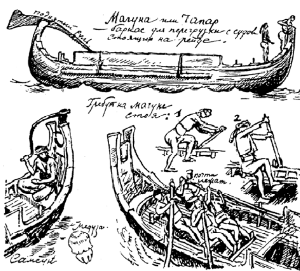
Илл. 3. Гребцы в Самсуне 1922 г. Рисунок Е. Е. Лансере (Лансере, 1925, с. 9)

По данным Фрунзе, рейд Самсуна вмещал от тридцати до сорока больших судов. Для облегчения загрузки и выгрузки в различных частях берега имелись две пристани на железных сваях, служившие для причаливания и отхода лодок и других неглубоко сидящих судов. Из этих пристаней одна, каменная, длиной 149 м, принадлежала таможне, и имела державшееся на железных сваях продолжение. Вторая пристань, располагавшаяся южнее, принадлежавшая раньше французской табачной фирме «Regie» (La Société de la regie co-intéressée des tabacs de l'Empire Ottoman), имела длину около 60 м. У пристани находились обширные складские здания [Фрунзе, 1929, с. 285–286].