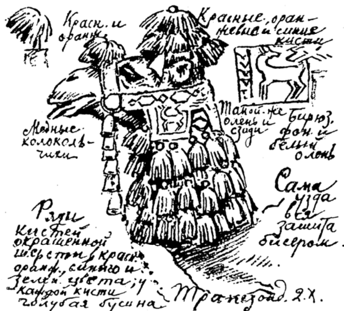
Илл. 1. Украшения верблюда из Персидского каравана в Трабзоне 2 октября 1922 г. Рабочий рисунок Е. Е. Лансере (по: [Лансере, 1925, с. 66])

Отмечая в дневнике, что общий колорит города чисто восточный, Фрунзе пишет далее: «Улицы узкие и извилистые, дома небольшие. Большое количество мечетей с высокими, стройными, конической формы минаретами» [Фрунзе, 1929, с. 277]. Лансере, впервые прибывшего в Трабзон в начале июня 1922 г., с первых же шагов особенно заинтересовало неожиданное своеобразие некоторых домов, как он выразился, «их капризная непринужденность» [Лансере, 1925, с. 24]. Главная особенность некоторых домов состояла в «сдвигах», то есть в часто встречающемся в городе варианте установки общей