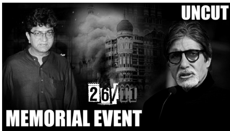
Илл. 2. Прасун Дзоши, поэт и исполнитель песен, и Амитабх Баччан, болливудский актер, — главные участники мемориальной программы, посвященной 26/11, у «Ворот Индии» в Мумбаи