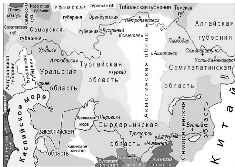
Илл. 1. Карта Степных и Сыр-Дарьинской областей, конец XIX в. (по: Мясников Е. А. Реформы Российской империи в Казахстане в XIX веке. Презентация . С. 39.

В 1876 г. земли Старшего, Среднего и Младшего жузов были разделены на шесть областей: Уральскую, Тургайскую, Акмолинскую, Семипалатинскую, Семиреченскую и Сыр-Дарьинскую области (илл. 1). В 1867–1868 гг. были утверждены «Временное положение об управлении в Семиреченской и Сырдарьинской областях» и «Временное положение об управлении в степных областях Оренбургского и Западно-Сибирского генерал-губернаторства».