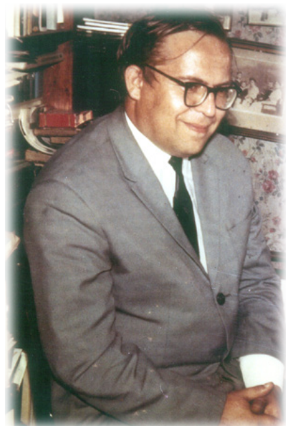
Рис. 2. Бронислав Иванович Кузнецов. Фото 1950-х гг.