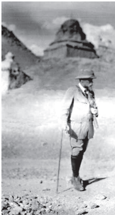
Рис. 5. Н. К. Рерих в Ладакхе. 1925.