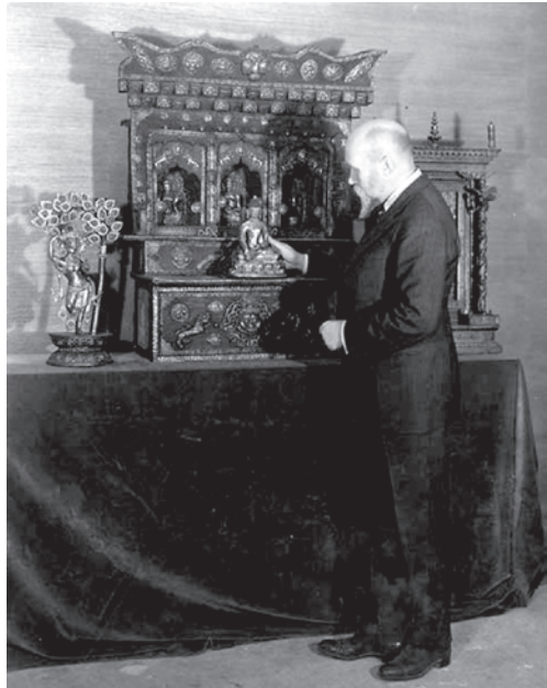
Рис. 3. Н. К. Рерих в буддийском зале Музея Н. Рериха в Нью-Йорке. 1929

В изучении монастырей Сиккима Н. К. Рерих опирался на богатый опыт своих полевых работ в России. Он четко знал, в каком направлении вести исследование, что спрашивать у местного населения и монастырских лам. Несмотря на то что по религиозным причинам раскопки производить было невозможно, тем не менее был собран интересный исторический материал, а также произведения буддийского искусства: тханки, предметы религиозного культа, бронзовые скульптуры, а также буддийские книги. Многие экспонаты из собранной Рерихом коллекции буддийского искусства составили экспозицию