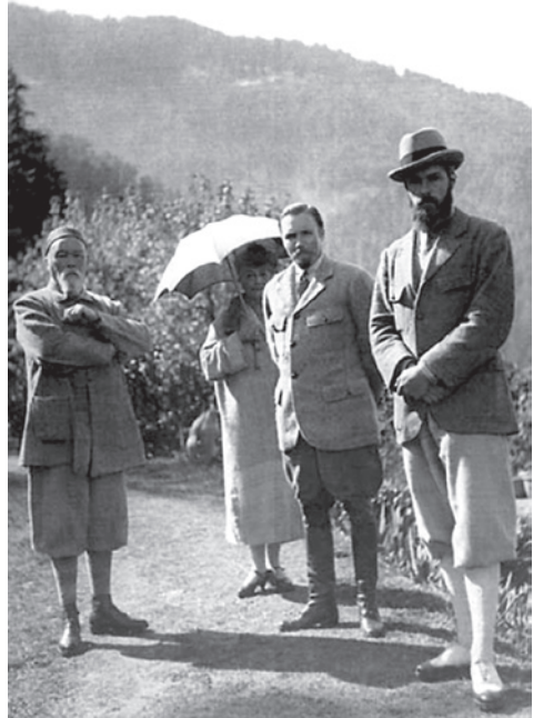
Рис. 1. Н. К. Рерих, Е. И. Рерих, Ю. Н. Рерих, С. Н. Рерих. Наггар, Индия. 1932–1933.

Значительная часть жизни Рерихов прошла в Индии. С 1928 г. и до ухода из жизни Н. К. Рериха семья проживала в местечке Наггар в долине Кулу. Святослав после женитьбы на индийской киноак-