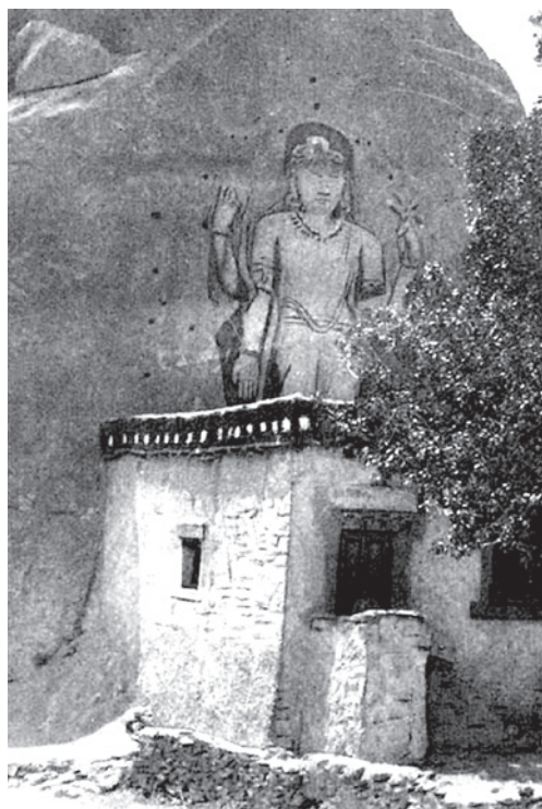
Рис. 4. Статуя Майтрейи. Мульбекх, Ладакх. 1925.

Что касается традиции устанавливать статуи Майтрейи как провозвестника светлого будуще-