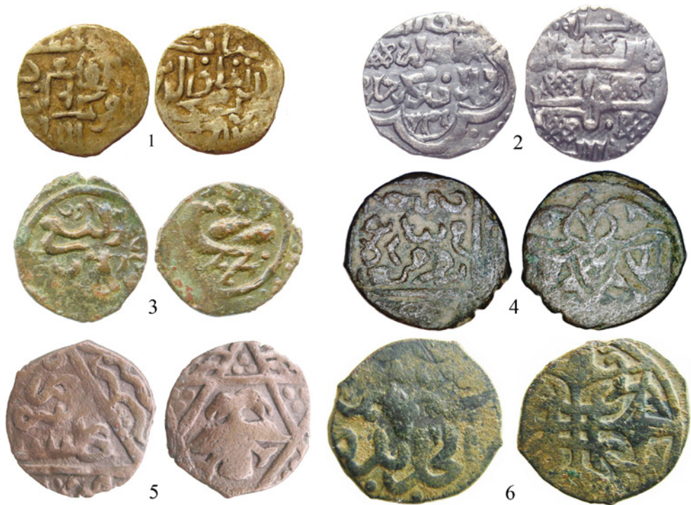
Рис. 1. Монеты, аналогичные опубликованным В. В. Григорьевым из собрания А. К. Казем-бека

XVIII. Пул времени хана Узбека, чеканенный в Сарае в 721 г. х. На оборотной стороне изображение хищной птицы (рис. 1.3).