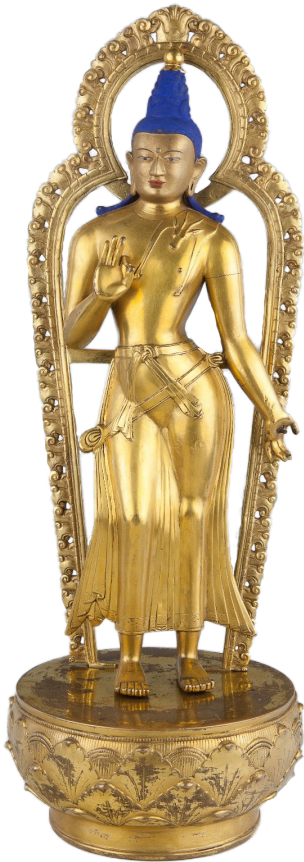
Рис. 4а. Скульптура Майтрейи. Бронза, литье, позолота, цветной пигмент. Размеры: 60,0×20 см. Конец XVIII – начало XIX в. Коллекция А. Алтангэрэла. Монголия. Вид спереди.

Лотос-постамент круглый, в реалистичной форме распускающегося бутона, фестончатые лепестки расположены тремя ассиметричными рядами по 12 лепестков в каждом. Верхний край постамента окружен жемчужной нитью (рис. 4б–в).