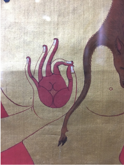
Рис. 3б. Фрагмент тангка «Бодхисатва Майтрейя» Дзанабазара. Правая длань бодхисатвы в жесте проповеди с изображением дхармачакры в центре ладони

лесистыми горами, где очень реалистично прорисованы хвойные деревья и кустарник (рис. 3в). На переднем плане – синие волны моря. Перед божеством, под лotosовым пьедесталом, стоит оранжевая чаша, пиала, наполненная подношениями Пяти органам чувств (панчака магуна). В верхней части тангка справа и слева изображены солнце и луна в виде двух дисков, в верхних углах – два золотых субургана, в киотах которых видна фигура восседающего будды.