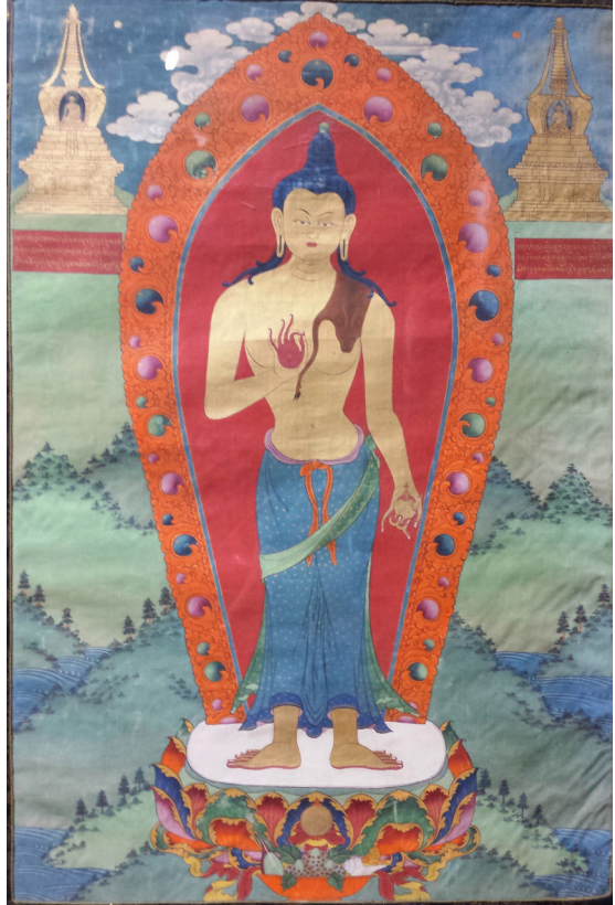
Рис. 3а. Бодхисатва Майтрея. Тангка, холст, размеры: 55×37 см. Обрамление: окантовка бежевым шнуром, рамка из сине-золотой парчи, деревянная рама с остеклением. Г. Дзанабазар. Середина XVII века. Музей изобразительных искусств им. Дзанабазара, Инв. № 66.01.11. 685–10 г. Улан-Батор

Композиция тангка очень четкая, ясная, контрастною цветом пятен полотно напоминает аппликацию с контурными силуэтами. Высокий горизонт делит пространство на синее небо со светилами дня и ночи, белыми облаками и бледно-зеленую землю, с треугольными,