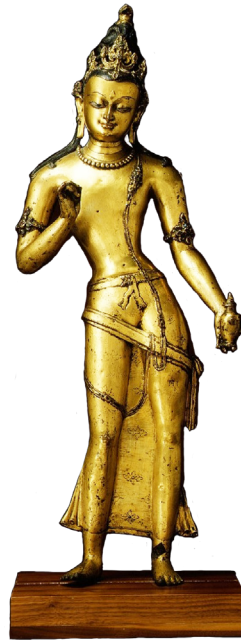
Рис. 9. Скульптура бодхисатвы Майтрейи. Золоченая бронза. Непал. XIV в. Музей искусств Метрополитен, Нью-Йорк. – https://www.himalayanart.org/items/86424/

Fig. 8. Sculpture of Maitreya. Copper alloy inlaid with silver and stones. Northern India. XI–XII centuries Pala-Sena style. Potala Palace, Lhasa, Tibet. Published by Ul. Von Schroeder [19].