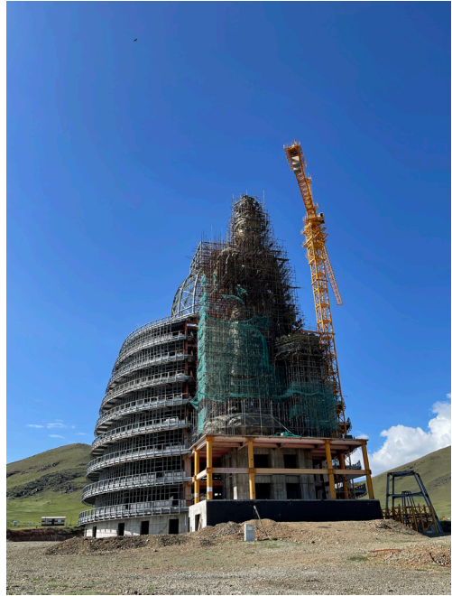
Рис. 7б. Состояние строительства летом 2022 г.

Fig. 7a. The project of the architectural complex in Mongolia “Ikh Maidar” [16, с. 2].