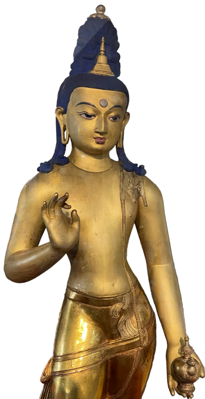
Рис. 1. Скульптура Майтрейи. Бронза, 72 см. Литье, позолота, цветной пигмент. Г. Дзанабазар. ≈1657 г. Монастырь Гандан, г. Улан-Батор. Монголия

выступают пучки тычинок. Лепестки лотоса имеют характерные для работ Дзанабазара клювики, что делает их похожими на спелые кедровые шишки с орехами. Изображения публиковались: [12, с. 64, ил. 44, 13: ил. 79].