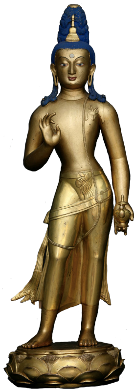
Рис. 2. Скульптура Майтрейи. Бронза, золото, пигмент. 68×45 см. Литье, позолота. Г. Дзанабазар. ≈1657 г. Музей-храм Чойжин-ламы, г. Улан-Батор. Инв. № Ө-42.61. 81-251

Fig. 1. Sculpture of Maitreya. Bronze, 72 cm. Casting, gilding, colored pigment. G. Zanabazar. ≈1657 г. Gandan Monastery, Ulaanbaatar. Mongolia