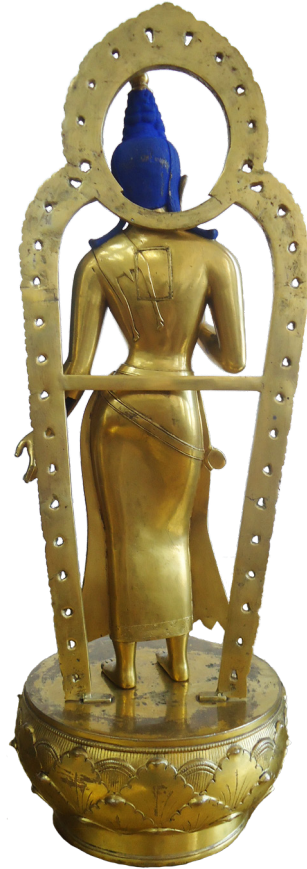
Рис. 4б. Скульптура Майтрейи. Бронза, литье, позолота, цветной пигмент. Размеры: 60,0×20 см. Вид сзади.

Fig. 4a. Sculpture of Maitreya. Bronze, casting, gilding, colored pigment. Dimensions: 60.0×20 cm. Late 18 th – early 19 th century. Collection of A. Altangerel. Mongolia. Front view.