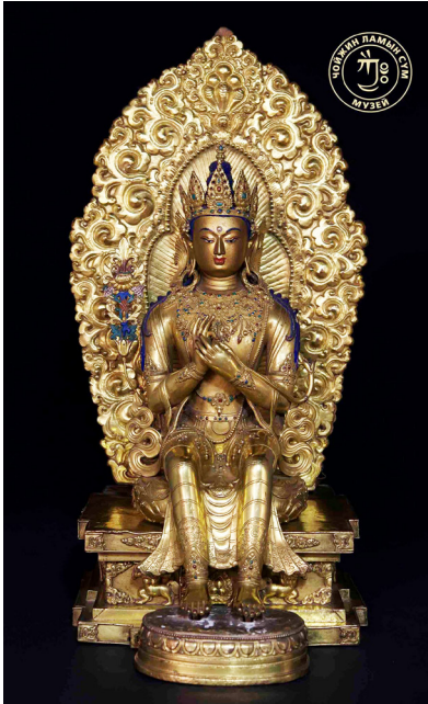
Рис. 5. Скульптура Будды Митрейи на троне. Медный сплав, золото, вставка из кораллов и бирюзы. Литье, выколотка. Размеры: 65×29,5×27 см. Вес 17 080 гр. XVII в. Музей-храм Чойжин-ламы, г. Улан-Батор. Инв. № 42-63. Θ-42-63.

своей почившей матушке Махамайе, которая там возродилась. Ученики Будды решили создать портрет учителя, чтобы легче было переносить его отсутствие. Когда Будда вернулся, созданная лучшими художниками статуя спустила ноги, чтобы приветствовать Тагхагату, но Будда велел ей оставаться, чтобы в будущем нести учение вместо самого Шакьямуни, и водрузил на голову статуе царскую диадему.