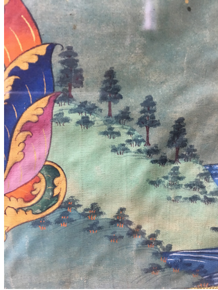
Рис. 3в. Фрагмент тангка «Бодхисатва Майтрейя». Пейзаж с реалистичным изображением растительности, характерной для Хангайских и Хэнтэйских гор Монголии

Fig. 3b. Fragment of the thangka “Bodhisattva Maitreya” by Zanabazar. The right hand of a bodhisattva in a preaching gesture with the image of the dharmachakra in the center of the palm