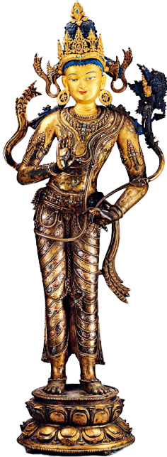
Рис. 8. Скульптура Майтрейи. Медный сплав с инкрустацией серебром и камнями. Северная Индия. XI–XII вв. Стиль Пала-Сена. Дворец Потала, Лхаса, Тибет. Опубликовано У. фон Шредером [19].

Fig. 8. Sculpture of Maitreya. Copper alloy inlaid with silver and stones. Northern India. XI–XII centuries Pala-Sena style. Potala Palace, Lhasa, Tibet. Published by Ul. Von Schroeder [19].