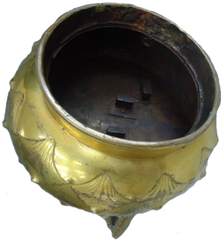
Рис. 4в. Скульптура Майтрейи. Бронза, литье, позолота, цветной пигмент. Размеры: 60,0×20 см. Дно пьедестала.