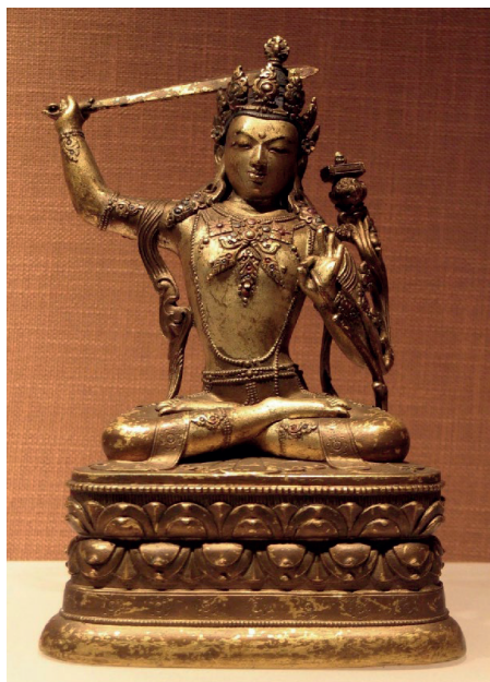
Рис. 7. Скульптура Манджушри. Бронза, литье, золочение. XVIII в. Столичный музей в Пекине, КНР

Аналог Манджушри Арапачана есть в коллекции Музея искусств народов Востока в Москве (ГМИНВ), бронзовая, золоченая скульптура средних размеров находится на постоянной экспозиции (рис. 9). Экземпляр похож на скульптуры из пекинских коллекций, но отличается формой украшений. Сдвоенные лепестки на полукруглом лotosовом постаменте расположены симметрично и так же перетянуты посередине.