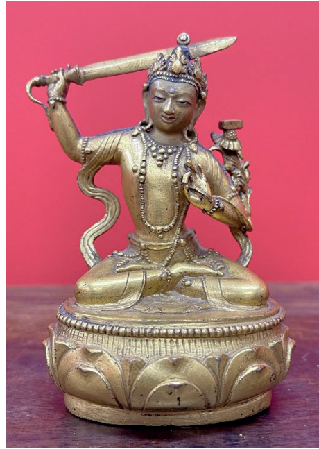
Рис. 6. Скульптура Манджушри. Бронза, литье, позолота, пигмент. Высота 11 см. XVIII век. Коллекция С. Гансуха. Улан-Батор, Монголия.

Fig. 5. Sculpture of Manjushri. Bronze, casting, gilding, pigment. 21 × 13.5 cm. 17 th – 18 th century. Collection of A. Altangerel. Ulaanbaatar, Mongolia