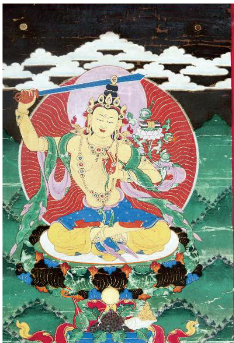
Рис. 3. Тангка Манджушри. Холст 44 × 30 см. Минеральный пигмент. Дзанабазар (1635–1723). Коллекция А. Алтангэрэла, Улан-Батор

Манджушри, изображенный на тангка, сидит в ваджрной позе (санскр. vajraparyāṅkāsaṇa), у него тело золотисто-оранжевого цвета, одна голова и две руки. Правой рукой он держит высоко поднятый, лазурный меч, левая рука в жесте проповеди (санскр. vitarkamudrā) держит стебель белого лотоса (рис. 3), на котором находится книга Праджняпарамита Сутра. Диадема на его голове состоит из пяти драгоценных лепестков, на центральном из них изображен Будда Акшобхья, родоначальник семейства Ваджра, к которому относится Манджушри. Высокая прическа с узлом (санскр. jaṭā-mukūṭa) обвита двумя ожерельями и увенчана драгоценным камнем; две боковые пряди волос ниспадают на спину. Нимб бледно-лиловый, ореол кирпично-красного цвета с золотыми волнами лучей, исходящими от тела божества. Ладони и подошвы окрашены в цвет охры, на подошвах можно увидеть крошечные знаки золотой дхармачакры . Желтая юбка- антаравасака подпоясана синим кушаком с изумрудно-зеленой