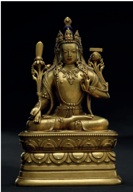
Рис. 2а. Манджушри сидящий. Латунь, литье, золочение, цветной пигмент. ЗДУМ, Инв. № 70.53.02. Улан-Батор, Монголия. Вид спереди

Манджушри изображен сидящим в ваджрапарьянка асане (санскр. vajraparyāṅkāsaṇa, vajrasana; тиб. rdo gje 'i skyil krung) — ноги скрещены, ступни лежат на бедрах подошвами вверх, с прямой спиной, правая рука у колена удерживает стебель лотоса с раскрытым бутонем, на котором расположен меч, левая — на уровне сердца, удерживает стебель лотоса с еще нераскрывшимся бутонем, на нем атрибут-книга, символ Сутры Праджняпарамиты (рис. 2а–б). Пьедестал — сдвоенные лотосы, перетянутые посередине, ряды его двойных лепестков расположены асимметрично друг другу. Атрибуты, короткий меч и кирпичик книги, изображены довольно условно, так же как у скульптуры стоящего Манджушри, описанного выше.