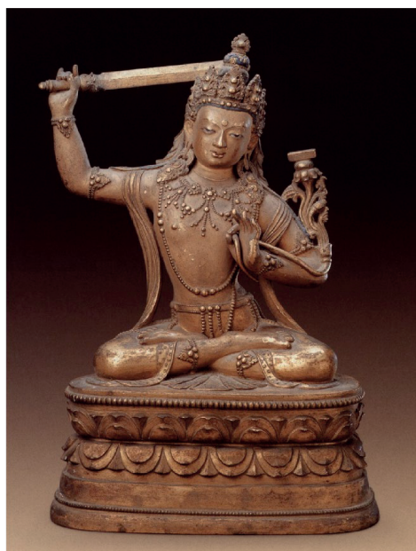
Рис. 8. Скульптура Манджушри. Бронза, литье, золочение. XVIII в. Императорский музей в Пекине, КНР [Himalayan Art Resources, item no. 5588]

Fig. 7. Sculpture of Manjushri. Bronze, casting, gilding. 18 th century. Capital Museum in Beijing, China