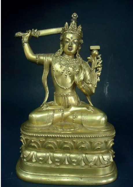
Рис. 5. Скульптура Манджушри. Бронза, литье, позолота, пигмент. 21 × 13,5 см. XVII–XVIII век. Коллекция А. Алтангэрэла. Улан-Батор, Монголия.

Fig. 5. Sculpture of Manjushri. Bronze, casting, gilding, pigment. 21 × 13.5 cm. 17 th – 18 th century. Collection of A. Altangerel. Ulaanbaatar, Mongolia