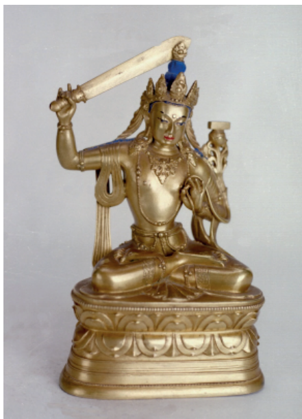
Рис. 4. Бронза, литье, позолота, цветной пигмент. 27,7 × 17 × 19 см. XVII–XVIII век. Музей Эрдэнэ-дзу, г. Хархорин, Монголия

Fig. 4. Bronze, casting, gilding, color pigment. 27.7 × 17 × 19 cm. 17 th –18 th century. Erdene-zu Museum, Kharkhorin, Mongolia