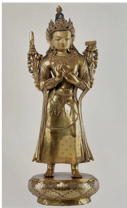
Рис. 1а. Скульптура Манджушри. Бронза, литье, золочение, цветной пигмент. Размеры 58,0 × 20,0 см. Вид спереди. ЗДУМ, Улан-Батор. Инв. № 69.45.33. 73-686