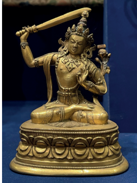
Рис. 9. Скульптура Манджушри. Бронза, литье, золочение. ГМИНВ, Москва.

Образ Бодхисаттвы Манджушри есть проявление культа знаний, символом чего выступает Сутра Праджняпарамита, а также всепроникающей мудрости, символом которой выступает меч, рассеивающий тьму невежества. Выявленные автором экземпляры культового образа божества мудрости исполнены в едином стиле, характерном для творчества Дзанабазара. Фигуры атлетического сложения пропорциональны, имеют специфические черты с маленькими, изящными кистями, полными предплечьями, точеными лицами и правильными чертами лица. Как у всех произведений Дзанабазара и работ, выполненных его учениками по моделям учителя, описанные образы имеют чистые, замкнутые контуры, скругленные формы, хорошо полированные поверхности, гладкие детали, они лаконичны, но очень выразительны и полны внутреннего динамизма.