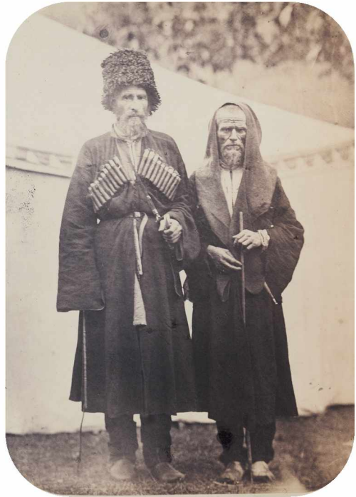
Илл. 6. Аибговцы. Фотография Главного Штаба Кавказской Армии. Из фондов ГИМ: 95171/10687. I VI 14254

Весной 1859 г. начальник военно-топографического отдела Главного Штаба Кавказской армии генерал-майор О. И. Ходзько в рапорте на имя Д. А. Милютина говорит о существовании в Тифлисе некоего «казенного фотографического заведения», на основе которого можно развивать военную