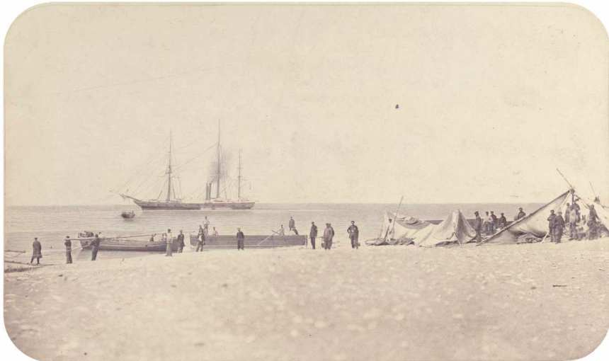
Илл. 3. Азовские баркасы. Фотография Главного Штаба Кавказской Армии. Из фондов ГИМ: 89430/5915. Ф. 17462

Учитывая особенности технологического процесса фотосъемки того времени — громоздкость и хрупкость аппаратуры, необходимость походной химической фотолаборатории для изготовления эмульсии для негативов — очевидно, что один человек не мог бы справиться с задачей съемки торжественных мероприятий. Небольшая разница в размерах, технические и стилистические особенности отпечатков, разные точки съемки одной и той же местности указывают на то, что в лагере одновременно присутствовало не менее трех фотокамер, т. е. работала группа профессиональных