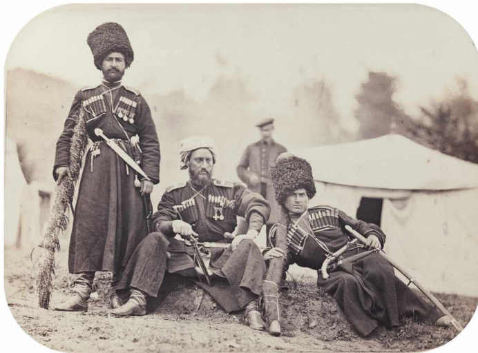
Илл. 5. Цебельдинцы. Фотография Главного Штаба Кавказской Армии. Из фондов ГИМ: 95171/10684. И VI 14251

Ill. 4. The Adzharians. Photo of the Main Headquarters of the Caucasian Army (Inscription in Russian). From the State Historical Museum collections: 95171/10678. I VI 14245