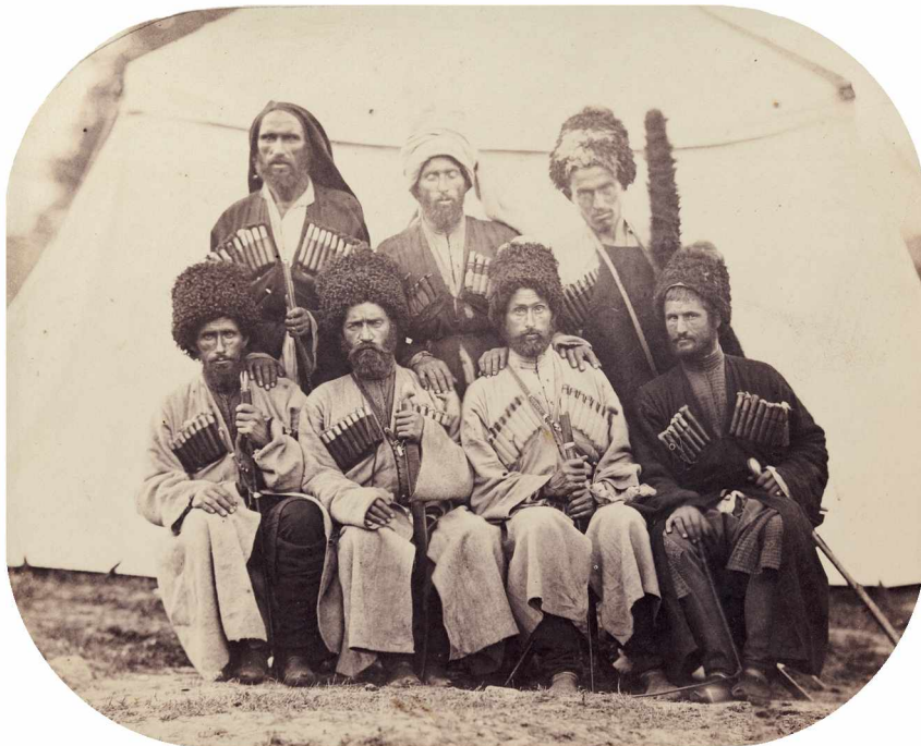
Илл. 2. Убыхи. Фотография Главного Штаба Кавказской Армии. Из фондов ГИМ: 95171/10688. I VI 14255