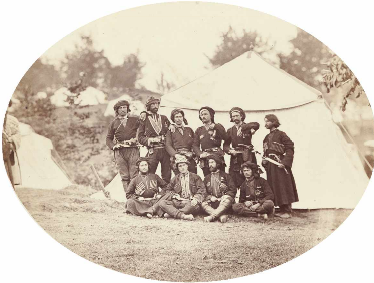
Илл. 4. Аджарцы. Фотография Главного Штаба Кавказской Армии. Из фондов ГИМ: 95171/10678. И VI 14245

Ill. 4. The Adzharians. Photo of the Main Headquarters of the Caucasian Army (Inscription in Russian). From the State Historical Museum collections: 95171/10678. I VI 14245