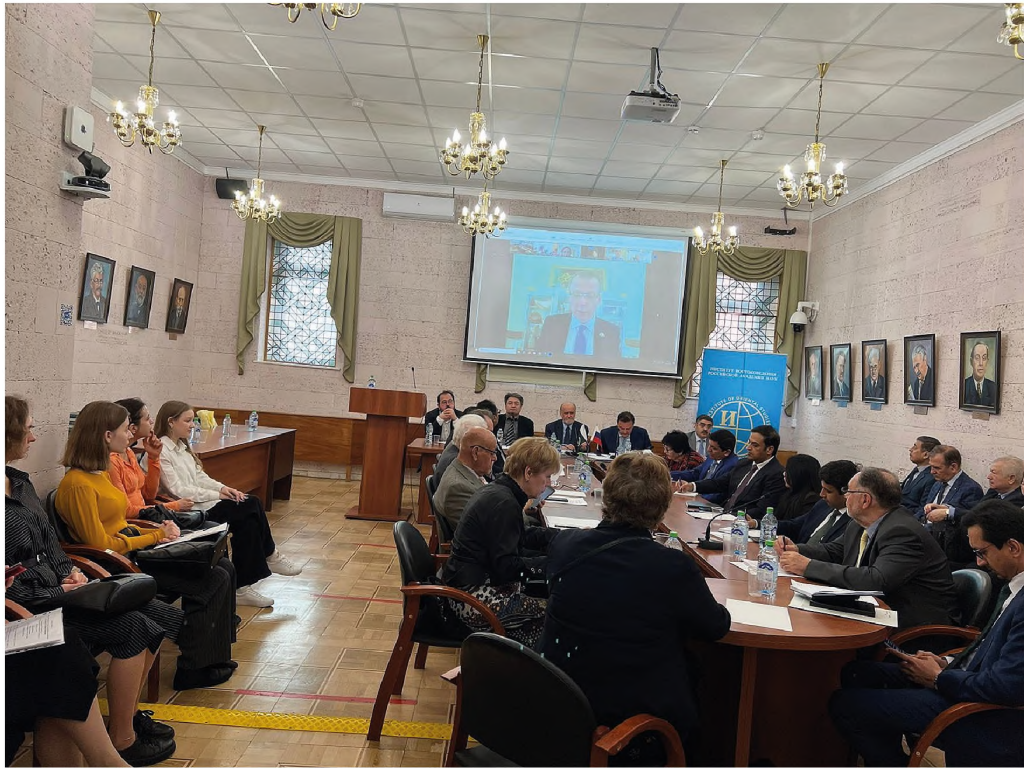
Выступление посла РФ в Пакистане Д. В. Ганича