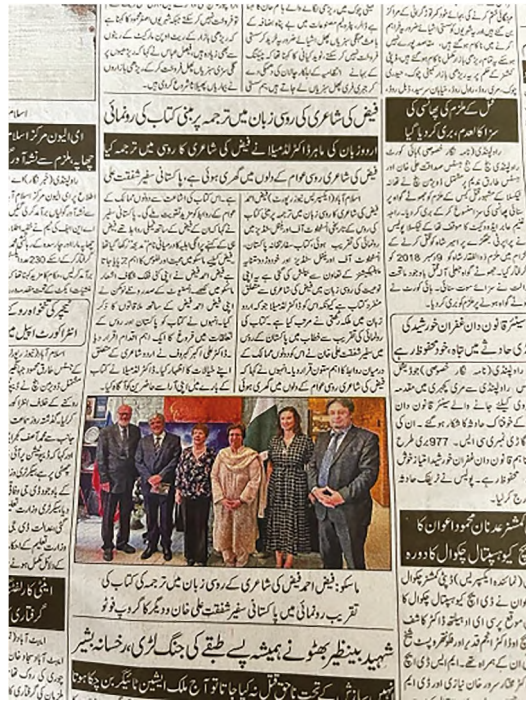
Освещение презентации сборника Фаиза в пакистанских газетах