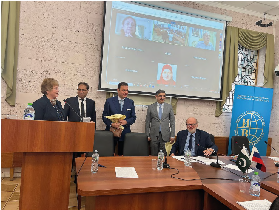
Вручение подарков почетным гостям