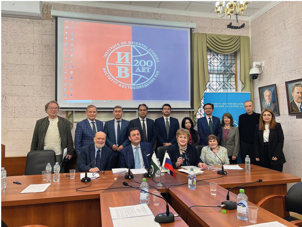
Общее фото участников конференции