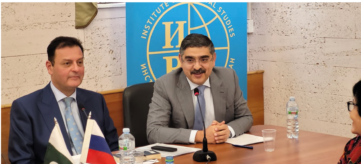
Почетные гости — сенаторы В. Икбал и А. Какар