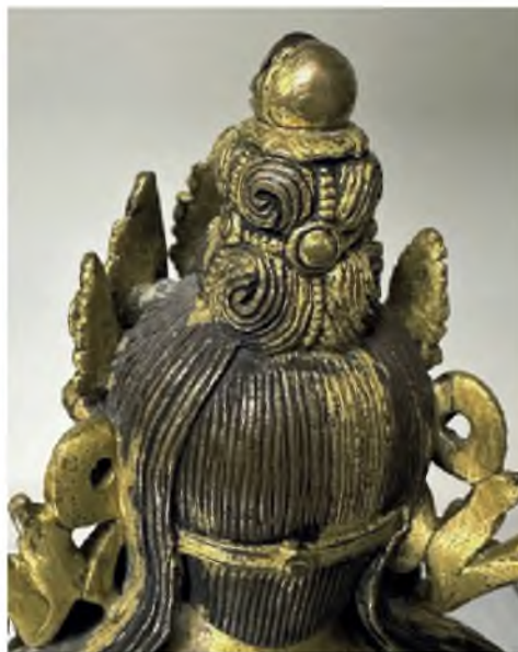
Рис. 3в. Скульптура Бодхисаттва Авалокитешвара Падмапани. Бронза, литье, золочение. Размеры: 22,5 × 8,0 × 12,0 см. Школа Дзанабазара. Конец XVII — начало XVIII в. Фрагмент, убранство головы, вид сзади.

Fig. 3b. Sculpture of Bodhisattva Avalokiteshvara Padmapani. Bronze, casting, gilding. Dimensions: 22.5 × 8.0 × 12.0 cm. Zanabazar School. The end of the 17 th — beginning of the 18 th century. Fragment: with antelope skin on the right shoulder.