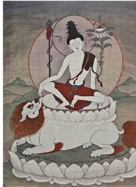
Fig. 4. Avalokiteshvara Simkhanada. Thangka. XVII century. Size: 44 × 30 cm. Frame: 79 × 45 cm. Museum-Palace of the Bogd Khan, Ulaanbaatar. Ref. No. 24-2-532.

Рис. 4. Авалокитешвара Симкханада. Тангка. XVII в. Размер: 44 × 30 см. Обрамление: 79 × 45 см. Музей-дворец Богдо-хана в Улан-Баторе, инв. № 24-2-532.