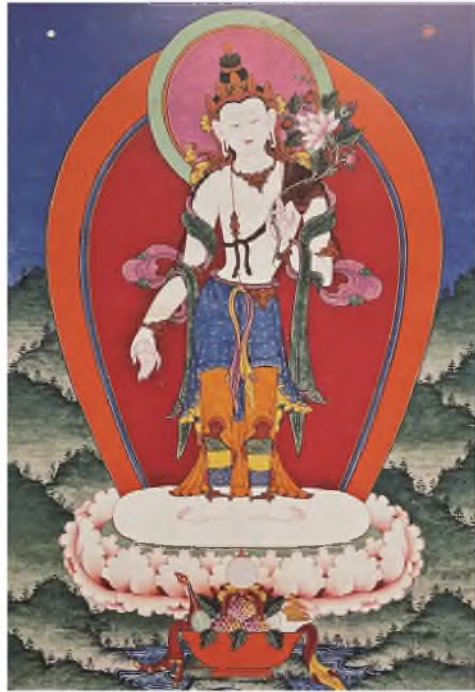
Рис. 2. Авалокитешвара Падмапани. Тангка. XVII в. Шелк, минеральный пигмент. Размеры: 47,0 × 32,0 см. Музей-дворец Богдо-хана. г. Улан-Батор, Монголия.

Падмапани — одна из форм бодхисаттвы Авалокитешвары, изображен в тонком проявлении самбхога-кайя (теле блаженства, которое могут видеть только опытные йогины). У него один лик и две руки, правая рука в жесте дарования блага ( варада мудра ), левой рукой на уровне груди удерживает пышную ветку, в которой есть распутившийся цветок лотоса, несколько еще закрытых бутонов среди зеленой листвы. Волосы убранны на макушке головы в высокий узел, увенчанный драгоценностью и перетянутый жемчужными нитями, а также скрывающий ушнишу 12 . У него 8 украшений бодхисаттвы: на голове пятилепестковая диадема, подвезанная лентами, концы ее развеваются за спиной, на шее кольцо с подвеской и длинное ожерелье, подвеска которого слегка сдвинулась влево на уровне пояса от легкого наклона корпуса тела влево. У него браслеты на запястьях, предплечьях и щиколотках с круглыми кольцеобразными вставками. Яркие шелковые одеяния оттеняют белизну тела, у него широкие плечи и узкий стан, нижняя часть одеяния состоит из трех частей: сверху синяя юбка, под ней оранжевая с красным подкладом, ноги обвиты полосатым бордюром нижнего дхоти, желто-сиреневый кушак завязан спереди, его концы свисают до колен. Верхняя часть одеяния, зеленая накидка с сиреневым подкладом, лежит на плечах, витиеватыми волнами спускается по рукам и свисает концами по бокам. Через левое плечо перекинута коричневая шкура волшебной антилопы кришнасары 13 , натуралистичные лапки которой связаны узелком под грудью. Кришнасара это символ его