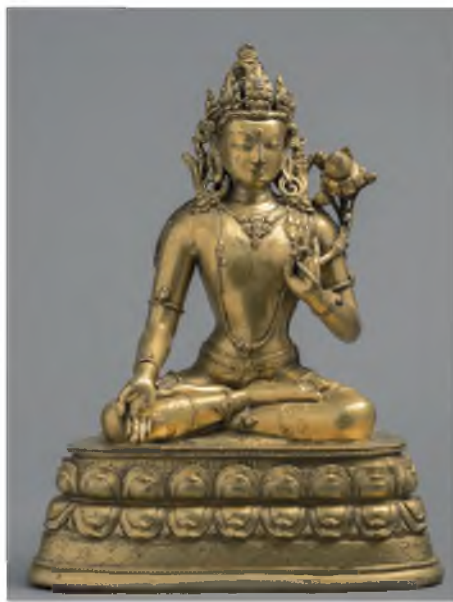
Рис. 3а. Авалокитешвара Падмапани. Скульптура. Бронза, литье, золочение, следы пигмента черного цвета на волосистой части головы. Размеры: высота 22,5 см, ширина 18 см, глубина 12 см. Вес: 1875,5 гр. Москва. Частная коллекция.

У этого Авалокитешвары Симкханады два отличительных атри-