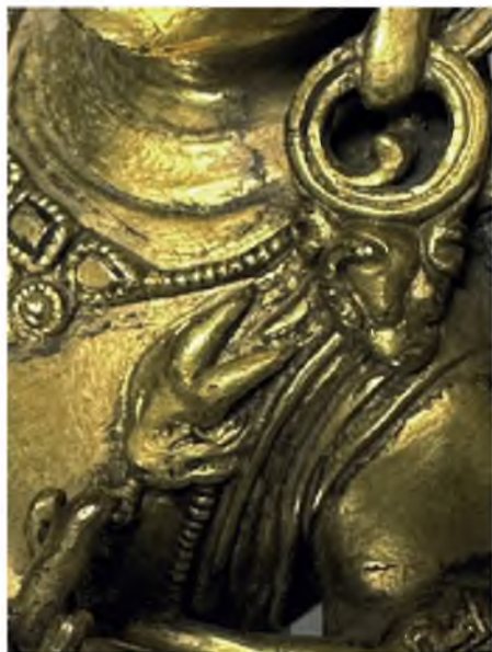
Рис. 3б. Скульптура Бодхисаттва Авалокитешвара Падмапани. Бронза, литье, золочение. Размеры: 22,5 × 8,0 × 12,0 см. Школа Дзанабазара. Конец XVII — начало XVIII в. Фрагмент, шкура антилопы на правом плече.

Fig. 3b. Sculpture of Bodhisattva Avalokiteshvara Padmapani. Bronze, casting, gilding. Dimensions: 22.5 × 8.0 × 12.0 cm. Zanabazar School. The end of the 17 th — beginning of the 18 th century. Fragment: with antelope skin on the right shoulder.