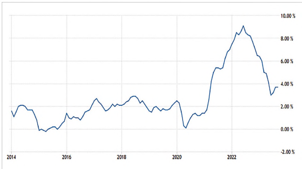
Рис. 3. Инфляция в США в 2013–2023 гг.