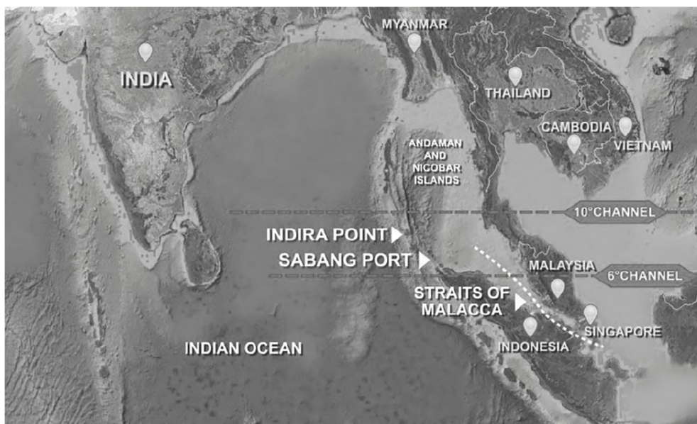
Рис 2. Порт Сабанг

Порт Сабанг расположен на оконечности острова Суматра, в провинции Ачех, в устье Малаккского пролива. Индонезия разрешила Индии инвестировать в порт, который является стратегическим и жизненно важным судоходным каналом. Малаккский пролив считается одним из самых важных судоходных путей в мире, и поскольку каждый год через него проходит около 100 000 судов, это самый загруженный пролив в мире. Это основной морской путь между Индийским и Тихим океанами, который связывает крупные державы, такие как Китай, Япония, Индия, Южная Корея, Малайзия и т. д. Стратегическое расположение Сабанга позволит Индии перехватывать китайские суда, курсирующие между Южно-Китайским морем и Индийским океаном.