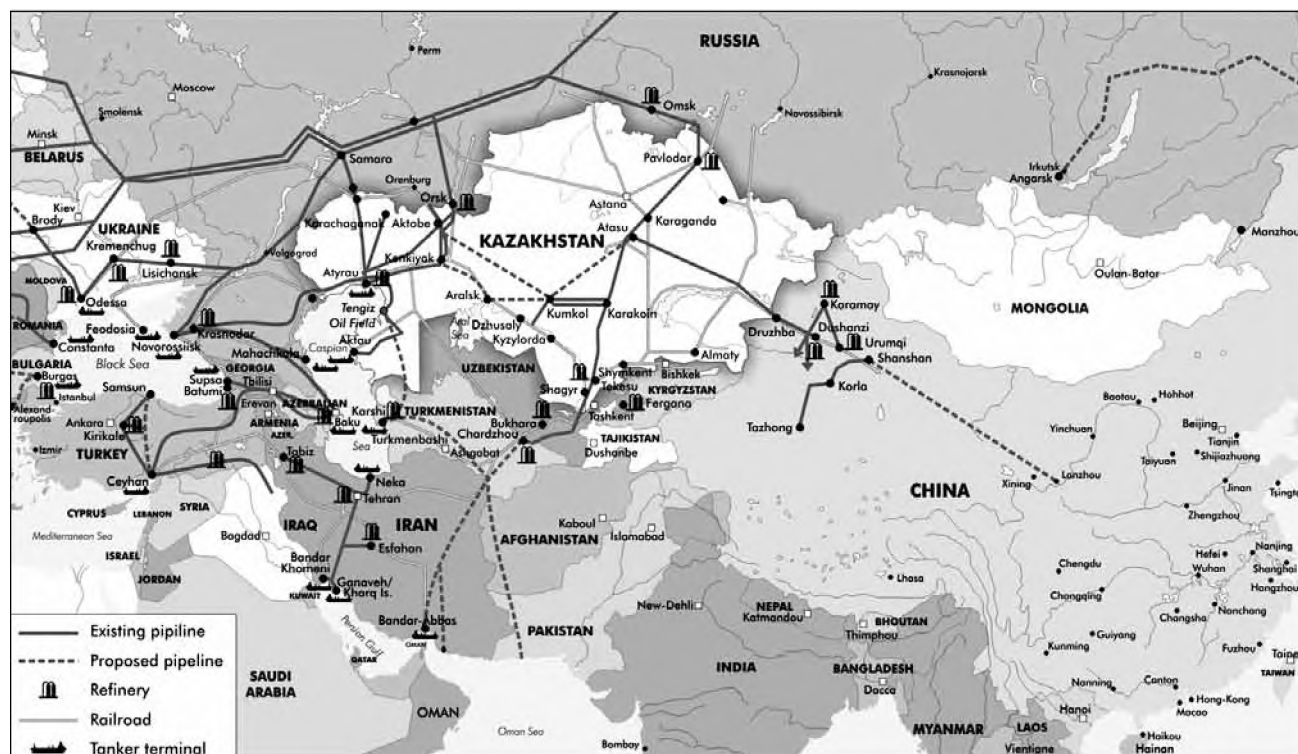
Рис. 2. Основные регионально-евразийские маршруты транспортировки нефти