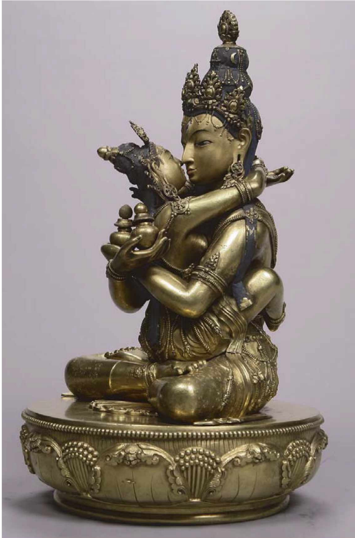
Рис. 1а. Сита Самвара (тиб. bde mchog dkar po ; старомонг. degedü amuyulang sayan / Дэмчиггарав ). Бронза, литье, золочение, цветной пигмент. Размеры 53 × 32 см. Вес 19 960 гр. Музей-храм Чойжин-ламы, Улан-Батор, Монголия