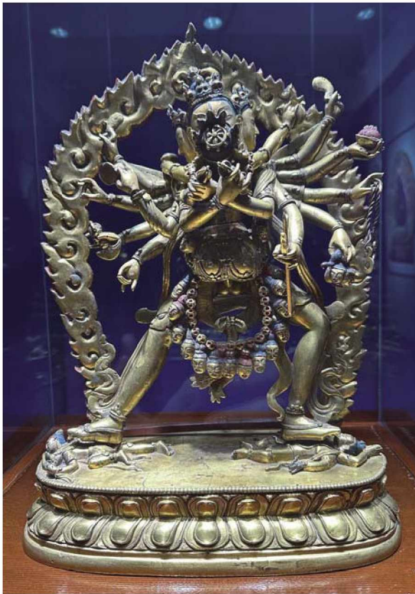
Рис. 6а. Скульптура Чакрасамвары в единении с духовной супругой (тиб. 'khor lo bde mchog yab yum). Бронза, литье, золочение. Школа Дзанабазара. XVIII в. Музей изобразительных искусств им. Дзанабазара. Улан-Батор, Монголия

Скульптура гневного облика Чакрасамвары есть в Музее изобразительных искусств им. Дзанабазара в Монголии. Иконография аналогична описанным выше образам, что расположены в центре сферических мандал — это двенадцатирукий и четырехликий Демчок, обнимающий супругу-юм. Божество Чакрасамвары и его супруга украшены гирляндами из свежесрубленных голов и диадемами из черепов, как и полагается гневным эманациям. Все атрибуты в шести парах рук присутствуют неповрежденными. Ногами он попирает фигуры Каларатри и Ямы, что символизирует победу над силами тьмы и смерти. Скульптура установлена на постаменте из сдвоенных лотосов, перетянутых посередине. За спиной установлена резная арка огненной прабхамандалы (рис. 6). Произведение относится к школе Дзанабазара, датировано XVIII веком.