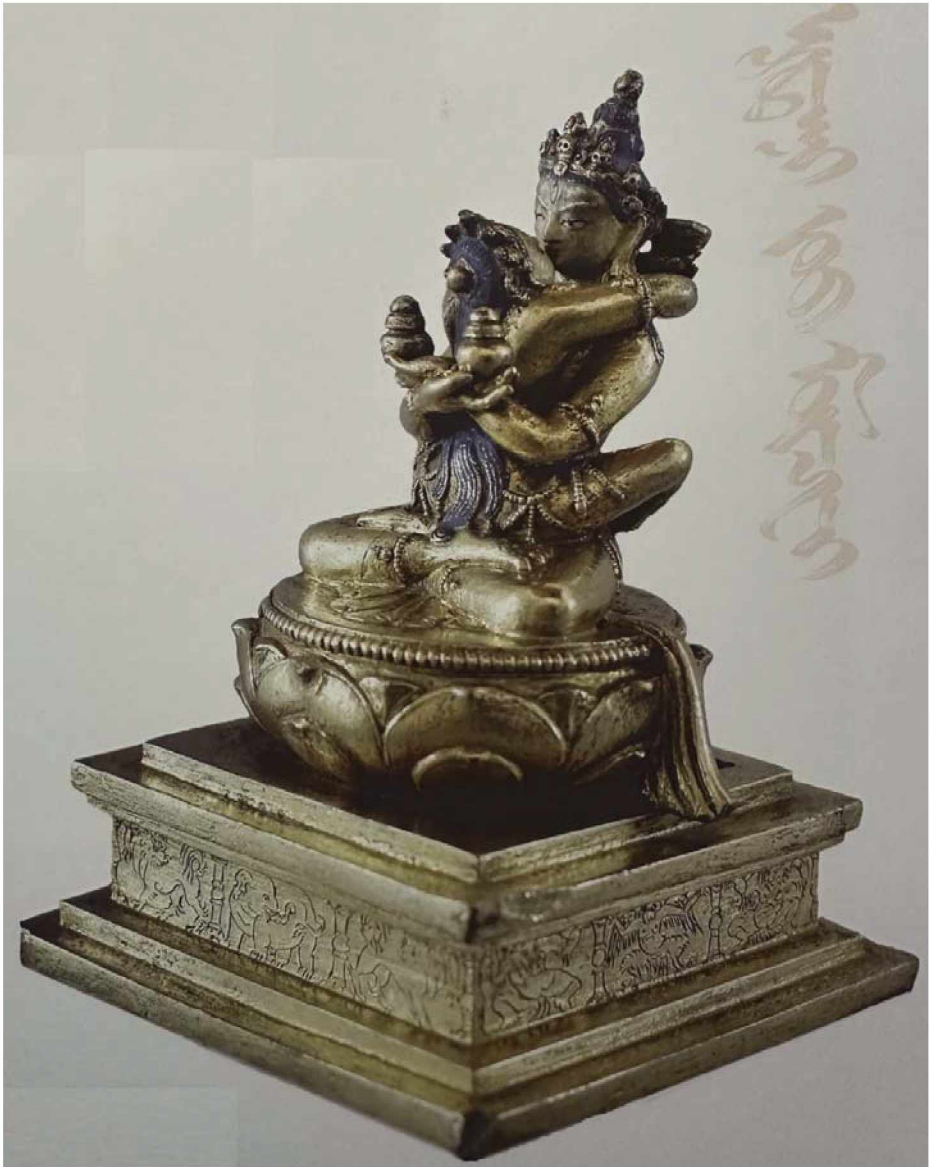
Рис. 2. Сита Самвара (совр.монг. Дээд Амгалант Цагаан). Бронза, литье, золочение. Высота 18 см. XVIII в. Музей Эрдэнэ-дзу, инв. № 65-02. Хархорин, Монголия [Их шүтээний орон Эрдэнэ Дзу. Ред. Н. Тумурбаатара. Эрдэнэ Зуу музей. 2020. Илл. 75, с. 119]