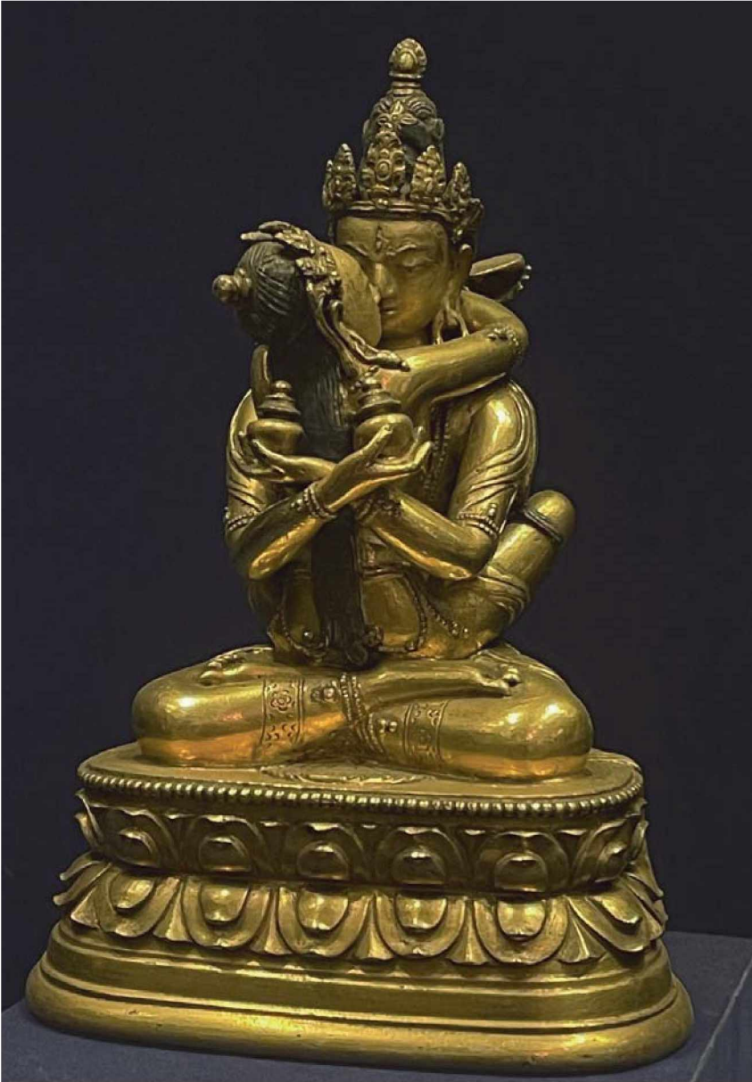
Рис. 3. Сита Самвара (совр. монг. Дээд Амгалант Цагаан). Бронза, литье, золочение. Высота 20 см. XVIII в. Музей Востока, Москва.