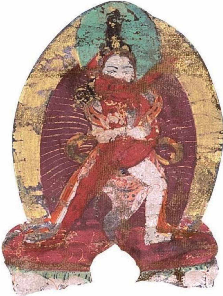
Рис. 7б. Дэмчог карпо яб-юм (тиб. Bde mchog dkar po tshe grub yab yum ) Белый Самвара долголетия. Фрагмент тангка «Совершенство трикайи»

цвета, один лик, две руки, стоит он в позе лучника (санскр. āldhāsana ), слегка согнутой левой ногой попирает грудь красной Каларатри, правой вытянутой в сторону ногой попирает голову черного Бхайравы. На бедрах повязана тигровая шкура. Он обнимает красную дакини Ваджраварахи (санскр. Vajravārāhī ; тиб. gdo rje phag mo ), руками, скрещенными за ее спиной, держит ваджр и колокольчик.