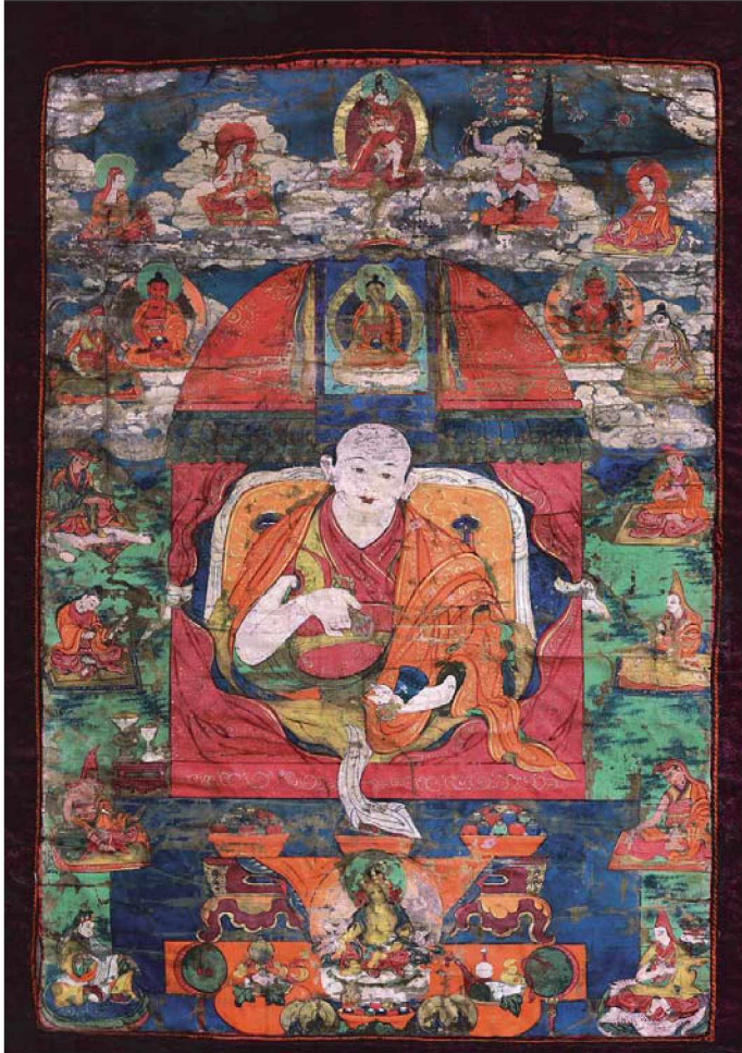
Рис. 7а. Тангка «Совершенство трикайи». XVII в. Г. Дзанабазар. Шелк, минеральные пигменты, позолота. Размеры: 45,0 × 30,0 см. Обрамление из шелка коричневого цвета. Коллекция Б. Амарсаны, Монголия

Наряду со скульптурными есть и живописное свидетельство о связи Дзанабазара с культом Белого Самвары. Композиция полотна включает крупный портрет Дзанабазара в центре тангка и 19 окружающих его персонажей. По центру в верхней части тангка изображен Дэмчог Карпо Цэдуб или Белый Самвара долголетия (тиб. bde mchog dkar po tshe grub ). Основная его функция — отсечение смерти и продление жизни (рис. 7а-б). У Самвары тело белого